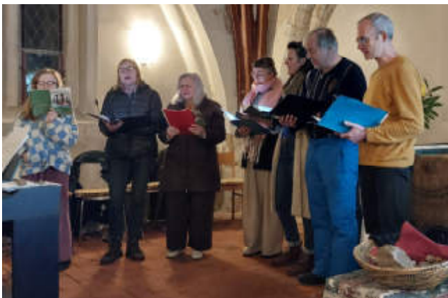
Der Chor sang die Lieder mit der Gemeinde.

Symbolisch konnten die Gottesdienstbesuchenden Steine ablegen, um ihre Last abzulegen. Im Anschluss an den Gottesdienst gab es die Gelegenheit beisammen zu bleiben mit Speisen, gekocht nach nigerianischen Rezepten. Musikalisch wurde der Gottesdienst vom Chor unter der Leitung von Kantor Reishaus bereichert.