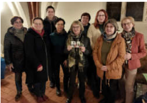
Das Vorbereitungsteam des Gottesdienstes.

„Kommt! Bringt eure Last.“ Beim diesjährigen Weltgebetstag stand Nigeria im Mittelpunkt. Namibia ist ein Vielvölkerstaat mit über 250 Ethnien und mehr als 500 gesprochenen Sprachen. Obwohl Nigeria über Erdölvorkommen verfügt, leben dort viele Menschen in Armut. Der Reichtum ist sehr ungleich verteilt. Nigeria leidet unter Umweltzerstörung, Armut, Korruption und Gewalt. Eine Gruppe von Frauen aus der