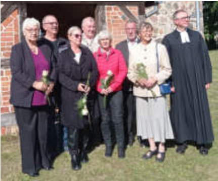
Goldene Konfirmation in Groß Pankow